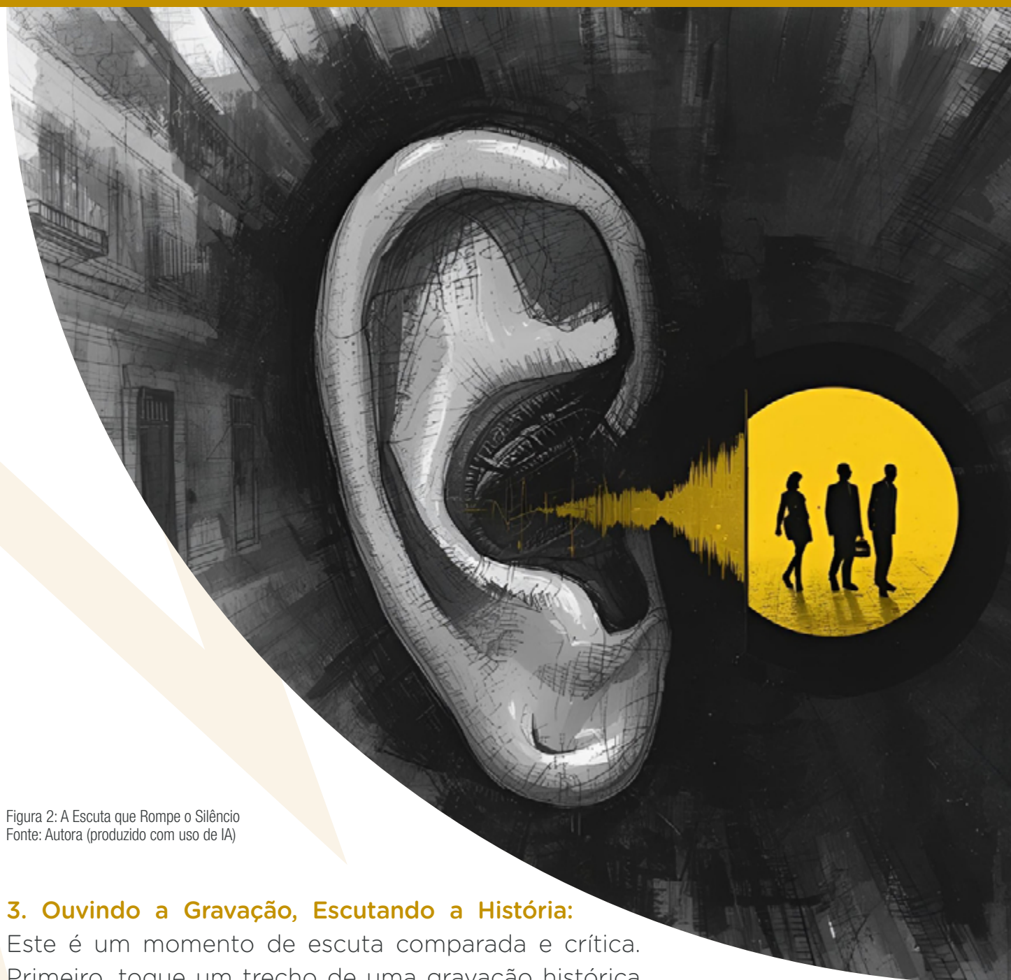
Figura 2: A Escuta que Rompe o Silêncio