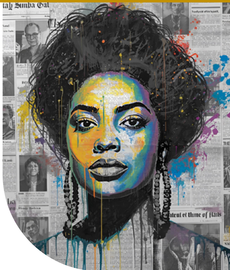
Figura 4: A Contranarrativa Visual