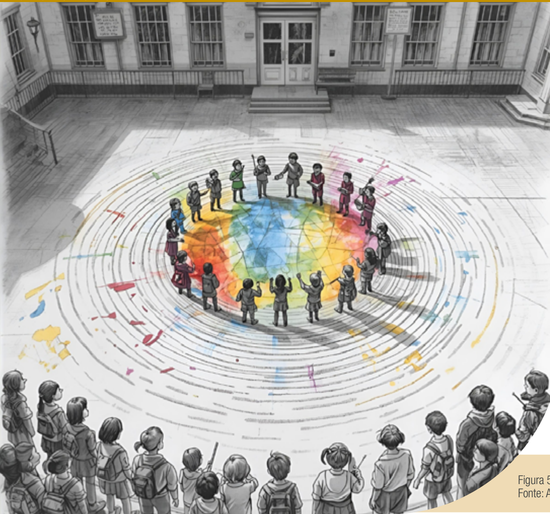
Figura 5: A Roda que ecoa no Mundo

3. Roda de Conversa e Manifesto: Após a performance, ainda no local da ocupação ou de volta à sala, o(a) professor(a) reúne a turma em uma grande roda de conversa reflexiva.