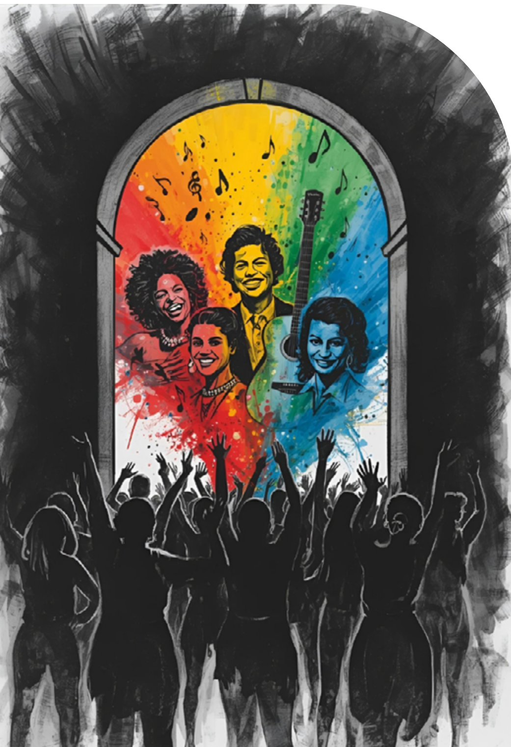
Figura1: Com a Palavra, as Mulheres do Samba.

O primeiro passo é dividir a turma em pequenos grupos, que funcionarão como “produtoras musicais”. Cada grupo será uma pequena produtora, responsável por tomar as decisões criativas em conjunto, realizar as atividades e organizar a apresentação final. A colaboração é a chave do sucesso, tanto dentro do próprio grupo ou entre os demais.