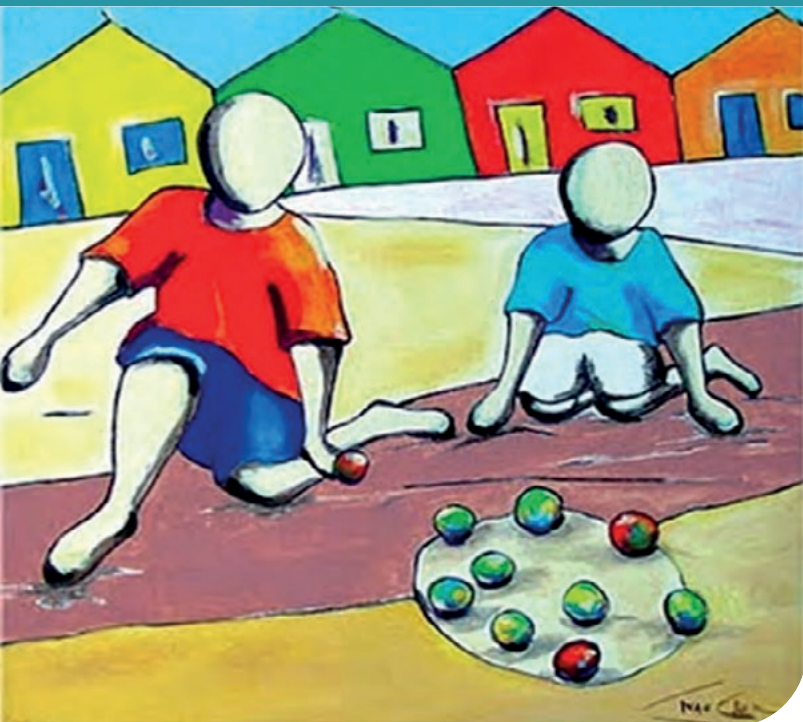
Brinquedos e brincadeiras da infância retratados na música Bola de Meia, bola de gude.

Métodos de avaliação: além da avaliação por meio da observação e participação dos alunos no decorrer da atividade, o professor pode utilizar mecanismos avaliativos, como palavras-chave sobre a atividade realizada e, a partir delas, realizar a síntese e discussão pelo grupo.