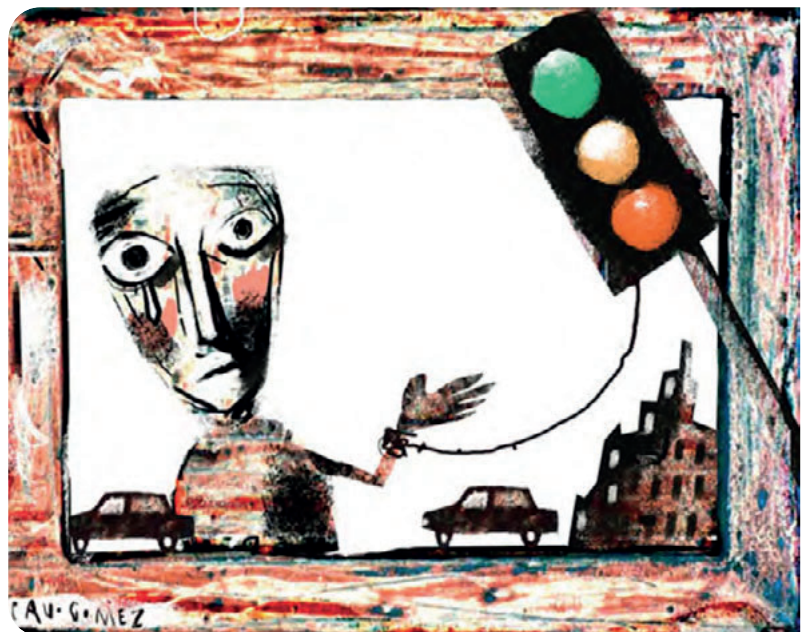
A infância desamparada retratada em Tá relampiano . Autor: Cau Gomez. Título: Sinaleira.

Métodos de avaliação: além da avaliação por meio da observação e participação dos alunos no decorrer da atividade, o professor pode utilizar mecanismos avaliativos, como palavras-chave sobre a atividade, listadas pelos alunos e, a partir delas, realizar a síntese e discussão pelo grupo.