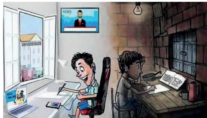
As distâncias do ensino a distância. Fonte: Andes (2020) 4

Em abril de 2020, através da Medida Provisória nº 394 (Brasil, 2020), foi oficializada a suspensão das atividades de ensino presencial no país, como medida preventiva à aglomeração e disseminação do novo coronavírus. Meses depois, em agosto de 2020, o governo federal, através da Lei nº 14.040 (Brasil, 2020), deliberou a retomada das atividades de ensino e aprendizagem na educação básica, em caráter emergencial. Nesse cenário, as instituições de ensino aguardavam não só um posicionamento sobre a realização das atividades pedagógicas, mas também um respaldo técnico-metodológico; neste segundo caso, sem êxito. Assim, sem uma avaliação prévia e sem medidas de planejamento e aplicação necessárias para uma transição adequada para o formato virtual, instituições de ensino, professores e alunos retomaram suas atividades virtualmente e tiveram que adotar modos alternativos e provisórios, cada contexto à sua maneira, para cumprir a de-