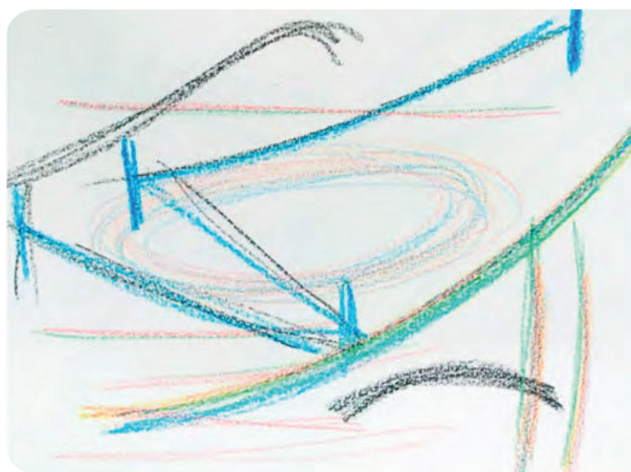
Registro fotográfico da produção de um aluno. Representação dos sons de uma pessoa brincando com uma bola em seu quintal.