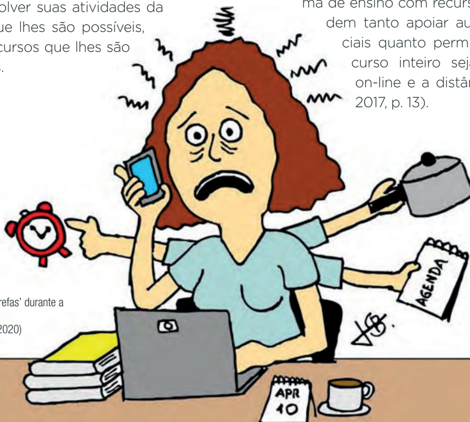
Professor 'multitarefa' durante a pandemia.

Para esse fim, diversas tipos de plataformas disponíveis trazem consigo um pacote de ferramentas para o ensino virtual, como é o caso dos AVAs, citado anteriormente, mas também há outras plataformas, utilizadas para ações de ensino a distância e formação complementar, como, por exemplo, a plataforma Moodle: um website/plataforma de ensino com recursos que podem tanto apoiar aulas presenciais quanto permitir que um curso inteiro seja realizado on-line e a distância (Jacks, 2017, p. 13).